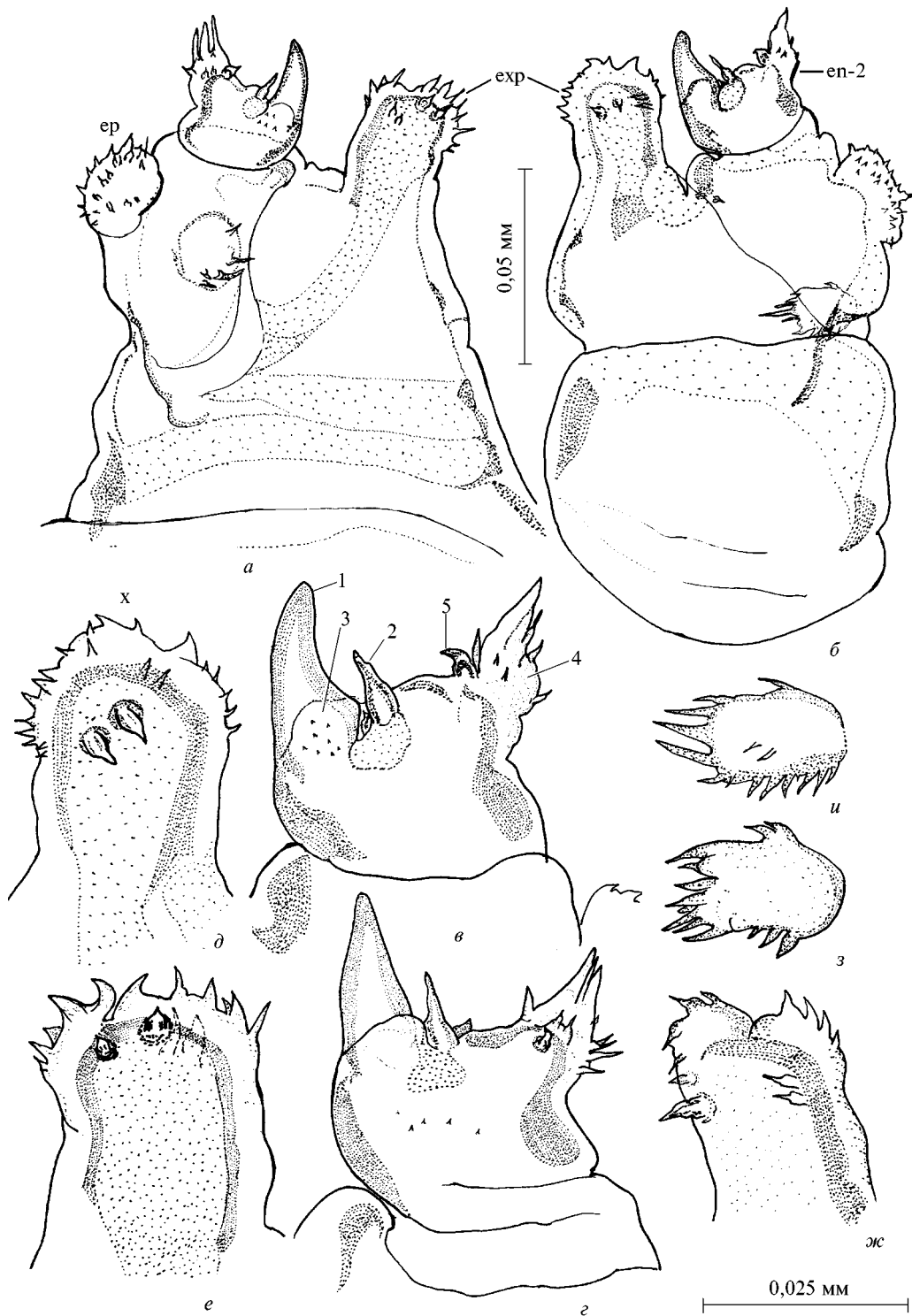
Рис. 2. Антенна II самки Salmincola mica , ♀: а, б — общий вид, латерально (en2 — дистальный членок эндоподита; ep — подушечка базального членка эндоподита с шипиками; exp — экзоподит; sp — подушечка симподита с шипиками); в, г — дистальный членок эндоподита, латерально (1—5 — структуры); д—ж — экзоподит, латерально (x — сосочек); з, и — подушечка симподита с шипиками.

Fig. 2. Second antenna of Salmincola mica , ♀: а, б — entire, lateral (en2 — distal segment of endopod; ep — spiny pad of basal segment of endopod; exp — exopod; sp — spiny pad of sympod); в, г — tip of endopod, lateral (1—5 — armature of the segment); д—ж — exopod, lateral (x — papilla); з, и — spiny pad of sympod.