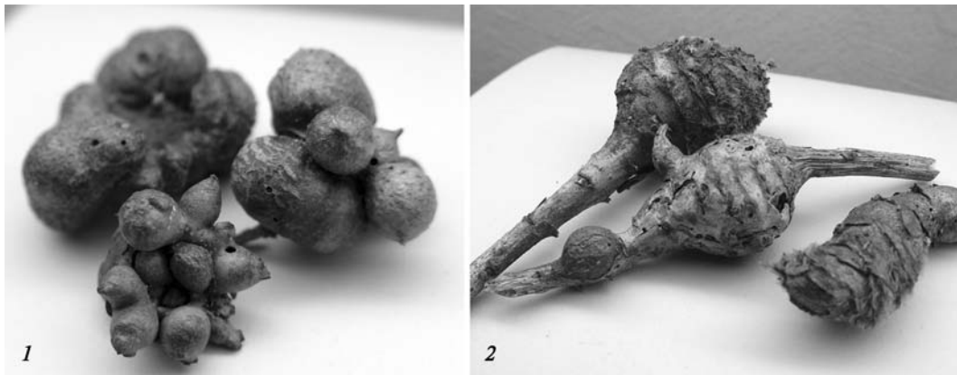
Рис. 1. Галли: 1 – Diplolepis mayri на R. canina ; 2 – A. hieracii на H. virosus .

Fig. 1. Galls: 1 – Diplolepis mayri on Rosa canina ; 2 – Aulacidea hieracii on H. virosus .